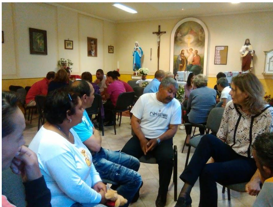
Roma szülők a szalézi munkatársakkal Balajton (A szülők között vannak, akik maguk is a Don Bosco Iskolába jártak)